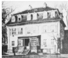
Im Dachgeschoss dieses Hauses wohnte Hey bei Wilhelm und Agnes Perthes (dem Gründer des Perthes-Verlages)

„Fünzig Fabeln für Kinder, mit Bildern“, die jeweils 1833 und 1837 im Gothaer Verlag Friedrich Perthes erschienen.